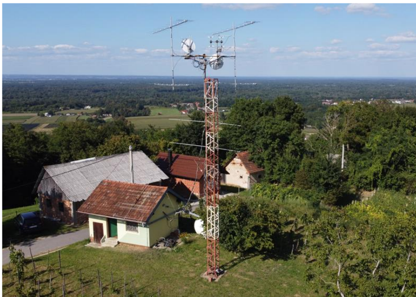
Memorijalna lokacija Josip Rihtarec Pepi iz zraka

Lokacija je izuzetno važna za rad kluba. Ona je preduvjet za vrlo dobre rezultate na području VHF i UHF rada u natjecanjima. Zbog same svoje lokacije na višoj nadmorskoj visini i prikaz je doseg kluba i iskustva i spretnosti članova. Zbog toga se konstantno ulaže u ovaj prostor.